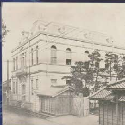
開館当時の私立大橋図書館