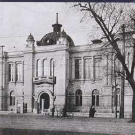
東京市立日比谷図書館