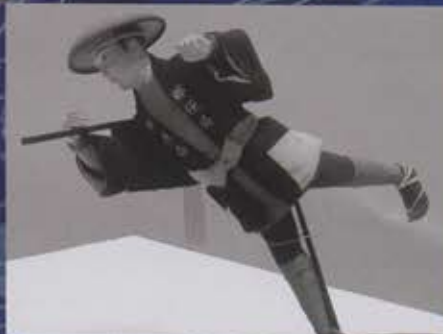
郵便物運送人(模型) 郵政博物館蔵